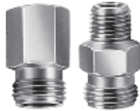
连接本体 (内螺纹或外螺纹)