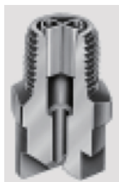
喷嘴内部有稳 流导向叶片